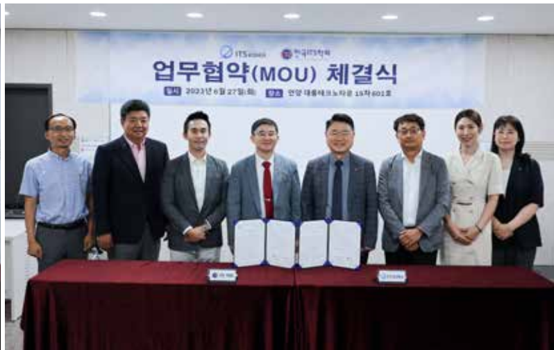
한국지능형교통체계협회와의 MOU 협약식(6.27)