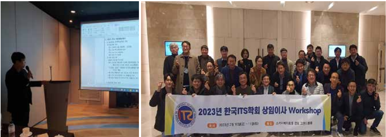
제2차 상임이사회의 및 상임이사 워크샵(2.10)