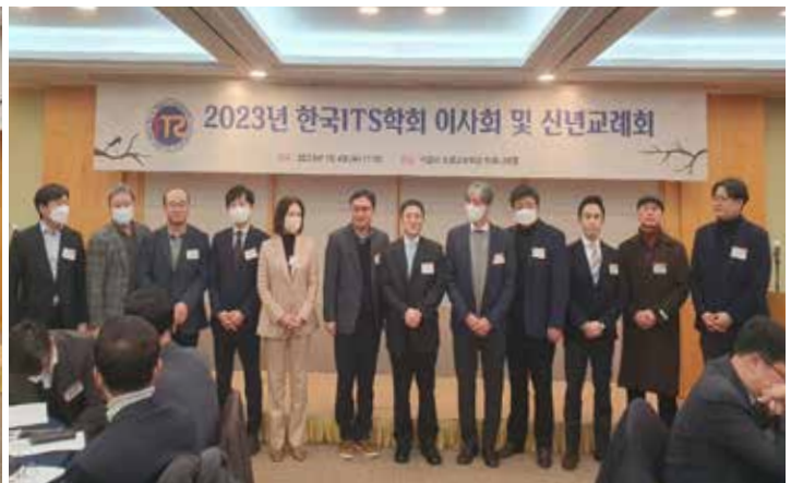
2023년 한국ITS학회 신년교례회(1.4)