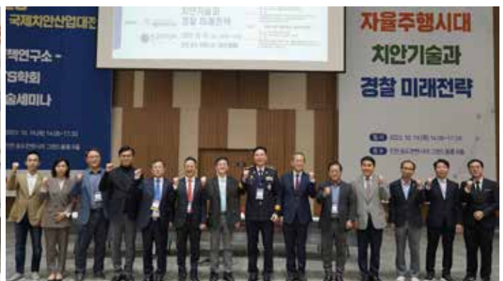
2023 국제치안산업대전 치안정책연구소-한국ITS학회 공동세미나 개최(10.19)