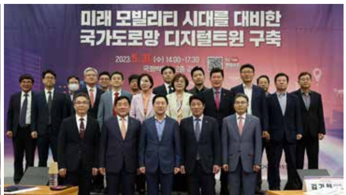
디지털시대, 공간정보산업 도약을 위한 대토론회(5.31)