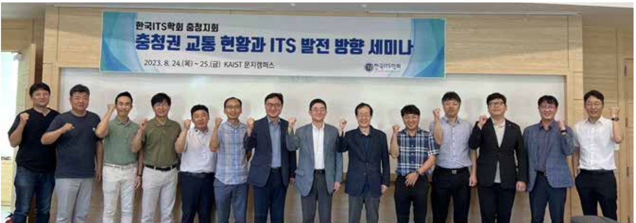
한국ITS학회 충청지회 세미나 개최(8.25)