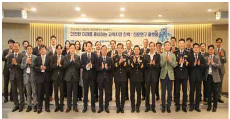
「안전한 미래를 준비하는 과학치안 전략: 전문연구 플랫폼」 학술대회 개최(6.28)