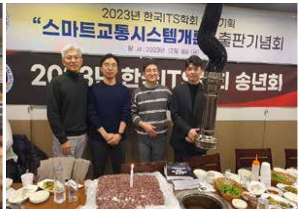
ITS 도서발간 기념식(12.8)